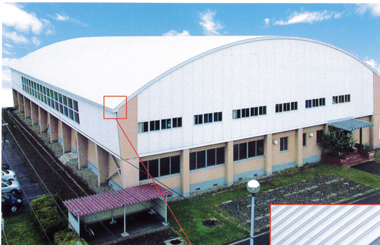
※写真の工法はフジサンルーフR曲げです。(瓦棒カバー工法)